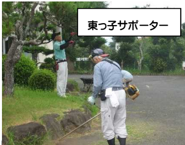
東っ子サポーター