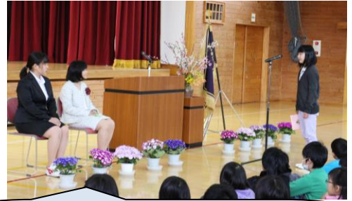
4/7着任式・始業式 新しい仲間・新しい先生との出会い！

朝、教室で担任の先生からのメッセージに迎えられ、「ようし、がんばるぞ」という思いが高まりました。