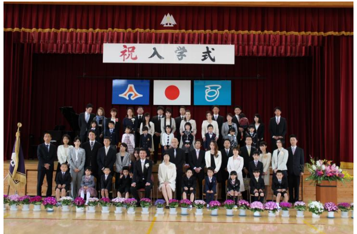
4/7入学式 18人のぴかぴかの1年生が仲間入り！ 6年生が全校を代表して参加しました。